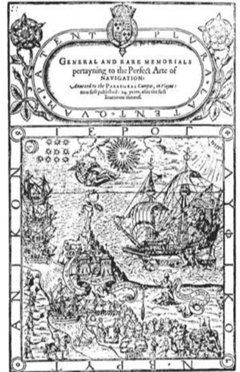
11 John Dee, General and rare memorials, 1577, title-page