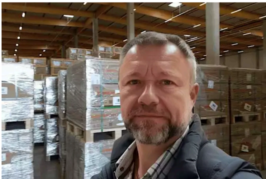
Die Wahrheit über Solar: Es lohnt sich nur, wenn Ihr Dach...