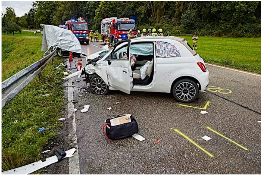
Kontrolle über Auto verloren: Zwei Jugendliche sterben