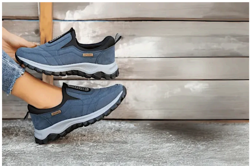
Testsieger: Schuhe für Polyneuropathie in den Füßen!