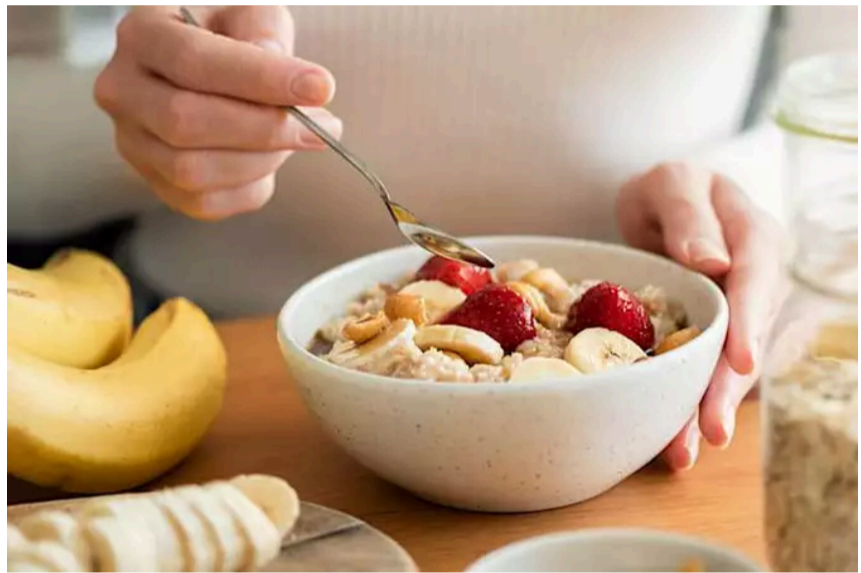
Diät-Experte: "In den Wechseljahren braucht man keine Diät, sondern einen bestimmten..."

Die Höhle der Löwen: Die Löwen trauen ihren Augen nicht - diese Gesichtspflege sollten Frauen kennen! Anzeige | glow-beauty.club