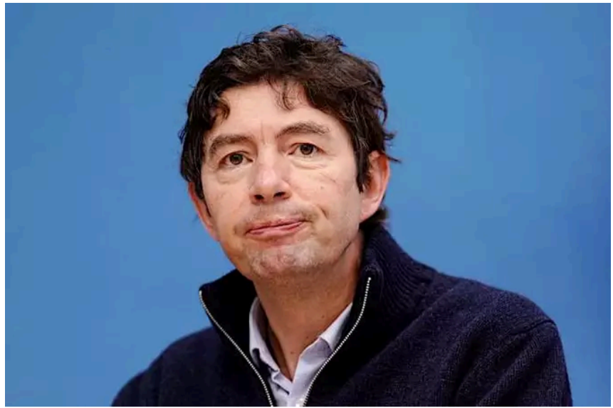
Virologe Christian Drosten: „Corona jetzt mit normaler Grippe vergleichbar“