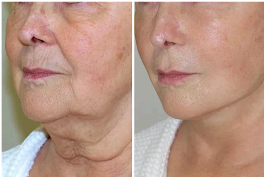
Sensation aus "Höhle der Löwen": Nur eine Anwendung am Abend reduziert schwabbelig...

Die Höhle der Löwen: Die Löwen trauen ihren Augen nicht - diese Gesichtspflege sollten Frauen kennen! Anzeige | glow-beauty.club