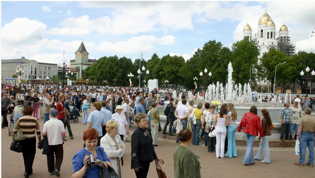
Neugestaltetes Stadtzentrum von Kaliningrad: Fernschreiben aus Moskau im Juli 1990

Dieser Beitrag stammt aus dem SPIEGEL-Archiv. Warum ist das wichtig?